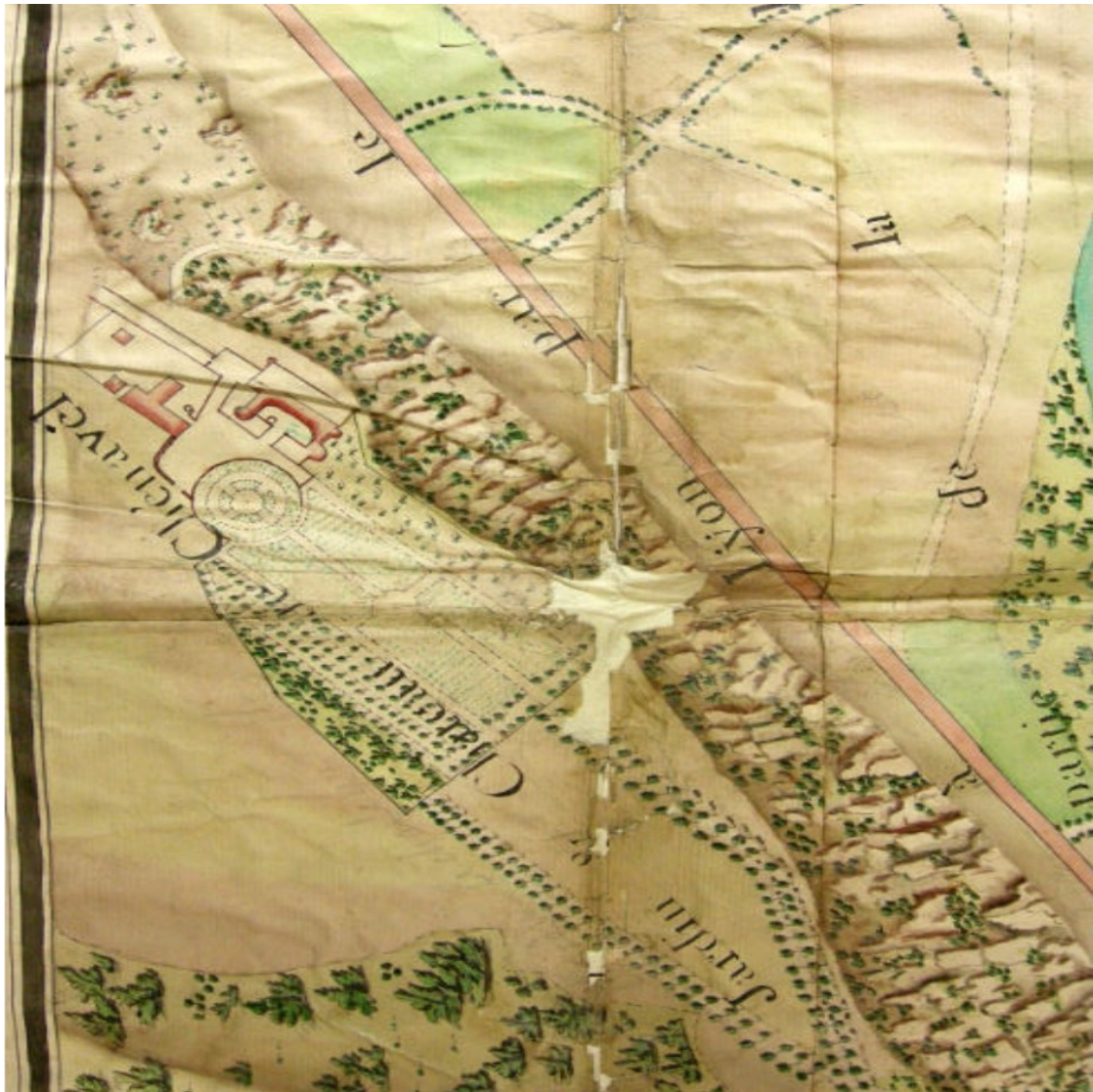
Plan de la propriété de Chenavel au XVIIIe siècle-Archives départementales de l'Ain, 100 Fi 1350, partie